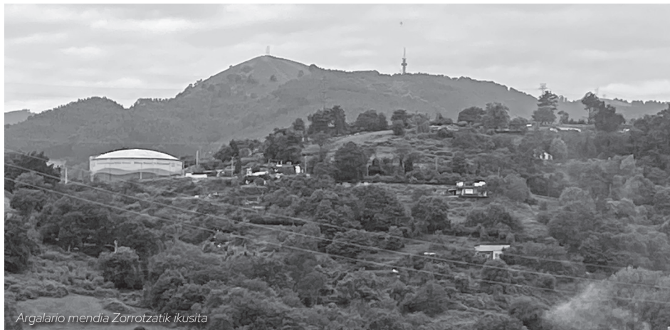
Argalarío mendia Zorrotzatik ikusita

Auzotik igotzeko Gurutzetara joango gara eta handik Gorostizara jeitsiko gara. Errepidea igarota Mengolearantza hartuko dogu bidea, errepidea jarraituz, pista bat ikusiko dogu, ez dau galtzerik. Jeisteko Zugastietarantz hartu ahal dogu bidea eta aukera bi, edo funikularra hartu eta Trapagaranen trenra edo busa itzultzeko edo antzineko mehatz trenbidera jeitsi ta Errekaorture (Erretuerto) etorriko gara lasai lasai bide lau eta on batetik.