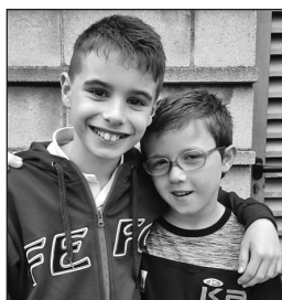
Aingeru eta Ekaitz

Udan normalean ez naiz auzoan egoten. Hala ere, ume helduagoentzat, 10 urtetik gorakoentzat, ekintzarik ez dagoela uste dut.