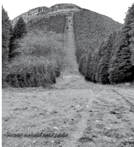
Suten aurkako ziurtagunea

Goizeko zazpiretan ateratak, arrasteko iluntze baino lehen helduko gara. Ure eroan (gogoratu iturriek, Trin, Zaldupen, suten aurkako ziurtagunea, Arroletza pean...), jana, eta gogoak!!!!