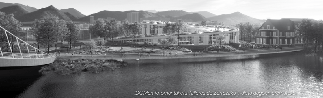
IDOMen fotomuntaketan Talleres de Zorrozkako txaleta dagoen eremurako

espazioak sortuz. Lau zubi ere planteatzen dira, hiru zirkulazio mistokoak (Elorrieta, Zorrotzaurre eta Burtzeñarekin) eta bat oinezkoentzat (Burtzeñarekin). Era berean, 58.126 metro koadro erreserbatuko dira berdeguneetarako Ibaizabal itsasadarraren eta Kadaguaren ertzeko eremu publikoa aprobetxatuz.