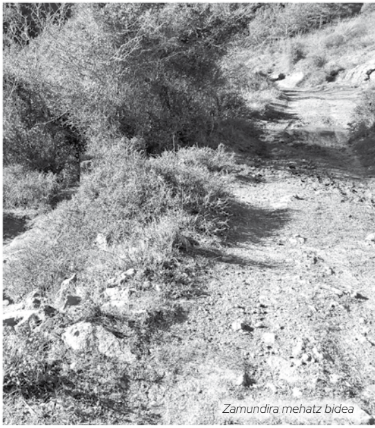
Zamundira mehatz bidea