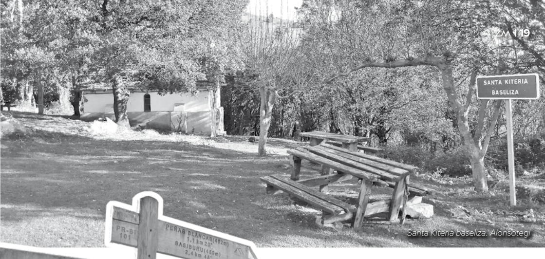
Santa Kiteria basiliza. Alonsotegi