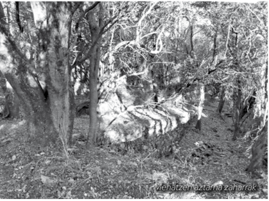
Mehätzen aztarna zaharrak