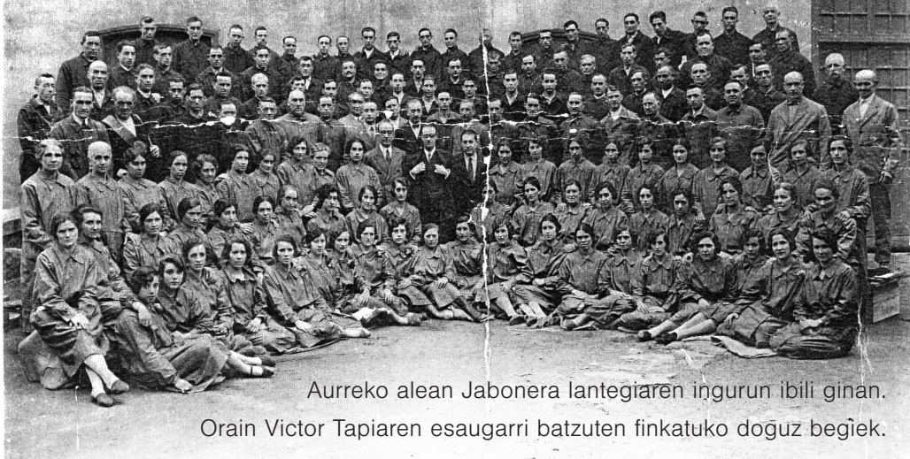
Aurreko alean Jabonera lantegiaren inguruan ibili ginan. Orain Victor Tapiaren esaugarri batzuten finkatuko duguz begiek.