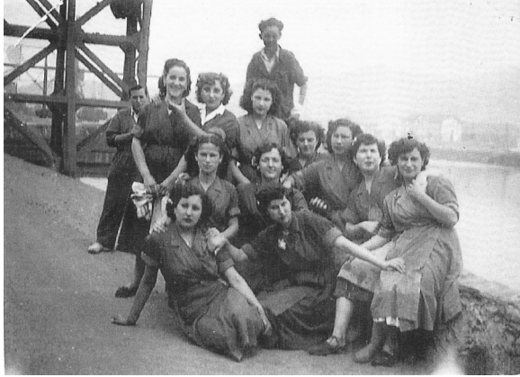
Jabonerako langileak kargaderoaren pean

eban, eta horrelako ekintzetako hiru ataletan sartu zan, etxebizitza, irakaskuntza eta osasuna. Eraiki ebazan, bere langilentzako, Jabonera langilen etxe taldea (auzoan), Guardiako "Victor Tapia" eskolak eraikitzeko diruz lagundu eban (primo de rivera garaian biak) eta Santa marina ospitalean tuberculosis gaitxotutako umeentzako Tapia pabiloia. Diruz lagundu eban ere Basurtuko ospitalean eta Gortizenean.