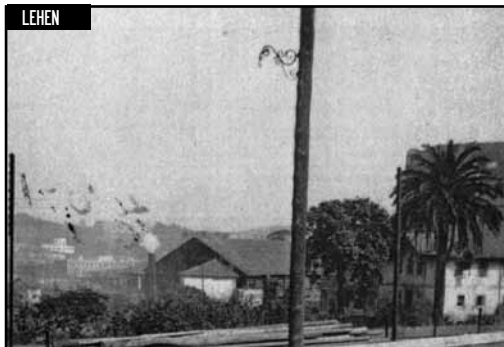
Zorrotza Kastrexana errepidea, Zalbidea aldapa

Estarta hau Zorrotza-Kastrexana errepidean hasi eta Zorrotzgoiti estartan amaitzen da. Bere garaian lantegi asko zegozan estarta honetan, tallerrak, serra bat, Boniren txatarrerria, Blanco Nuclear eta askoz gehiago. Baina hori baino lehen behorak goiko larretara, zazpilandetara, eramateko erabiltzen zan; trenbide paretik gora, handik bere izena.