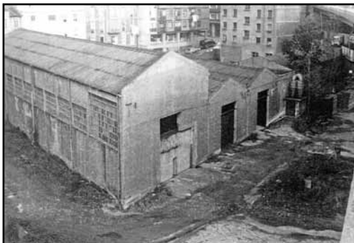
Serreria del Norte