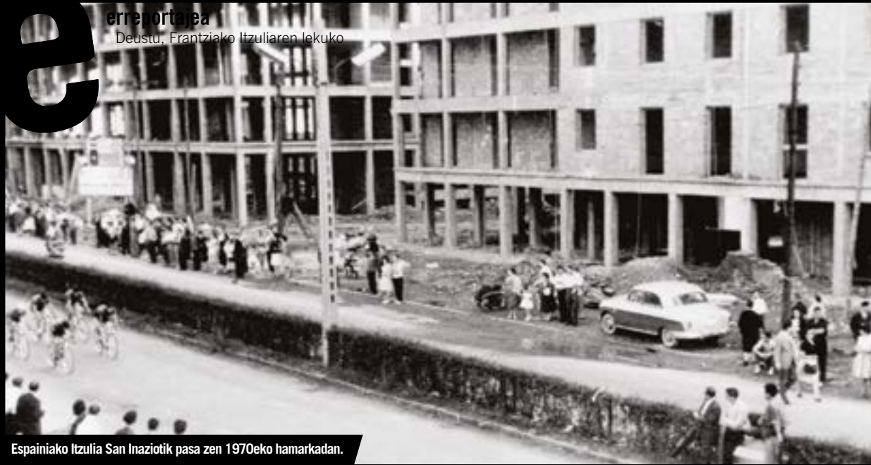
Espainiako Itzulia San Inaziotik pasa zen 1970eko hamarkadan.