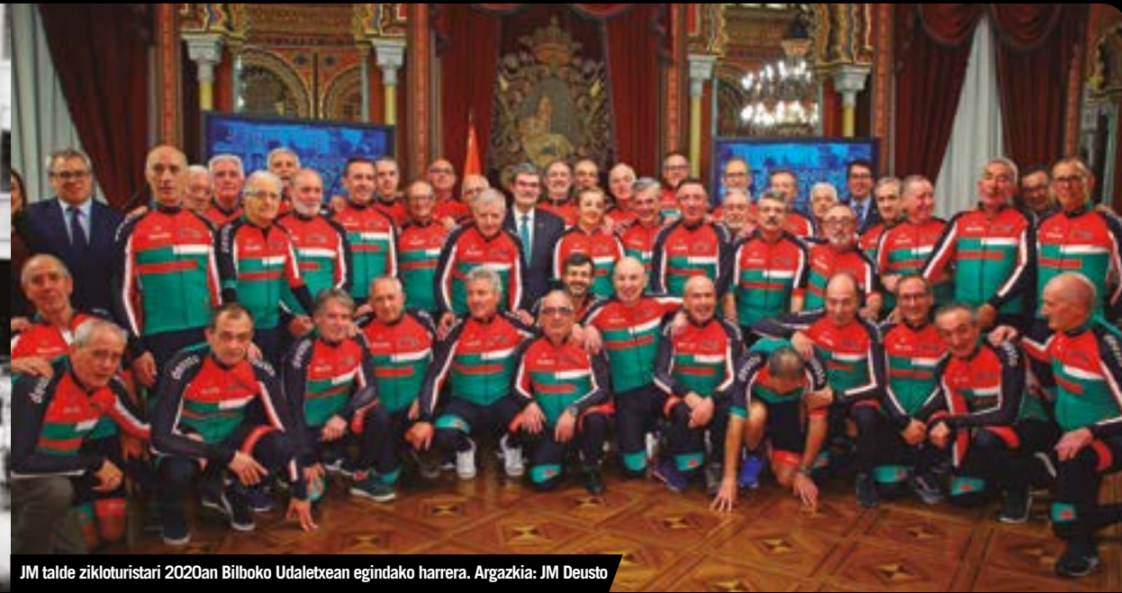
JM talde zikloturistari 2020an Bilboko Udaletxean egindako harrera.