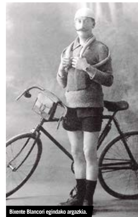
Bixente Blancori egindako argazkia.

iritsi zen. Bizikleta bat erosteko beste izan zuenean, entrenatzen hasi eta handik gutxira hasi zen lasterketetan. Era horretan, 1906ko Bizkaiko Txapelketan 4. gelditu zen, Sociedad Ciclista Bilbainarekin. Hurrengo urteetan, Blancok bere emaitzak koxka