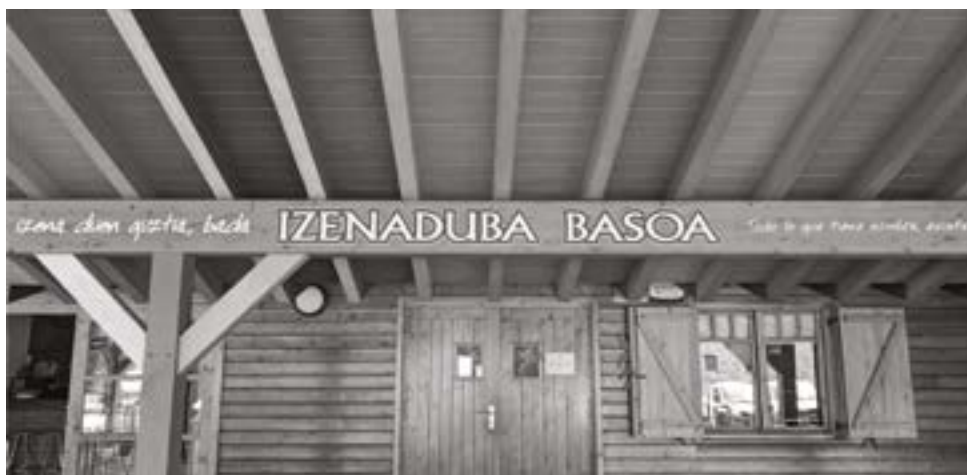
Testua eta argazkiak: Intxixu Ikastola

San Inazio Ikastetxean, Haur Hezkuntzako 4 eta 5 urteko ikasleek, gure kulturaren parte den euskal mitologia ezagutu dute. Eskolan bertan pertsonaia desberdinen artean murgildu dira, eta amaiera borobila emateko deskubrimendu prozesu honi, Izenaduba Basoa ezagutzera joan dira.